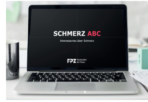
Online Edukation 1x