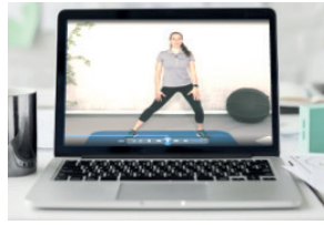
Online Übungseinheiten zu Hause 2x